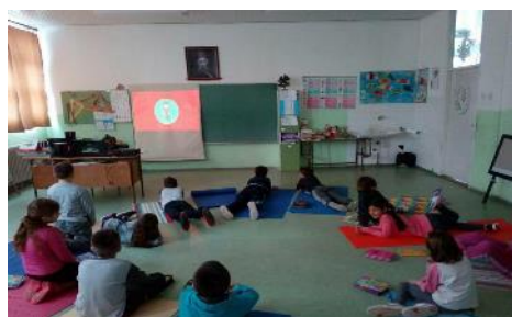
Концепт вршњачког насиља крз едукациони филм

Дисциплиновање дечјег начина размишљања у правцу конструктивног решења.