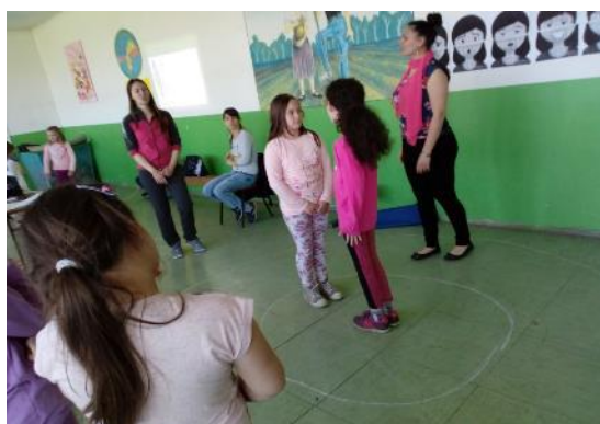
" Прекрстите друге руке "

Упознавање деце са невербалном комуникацијом (контакт очима, израз лица, покрети главе, гестови, држање и став, дистанца); уочавање невербалних знакова који доприносе здравој комуникацији.