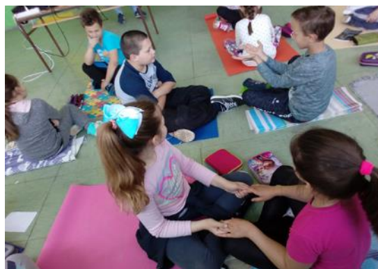
Зона осећања (не)пријатности