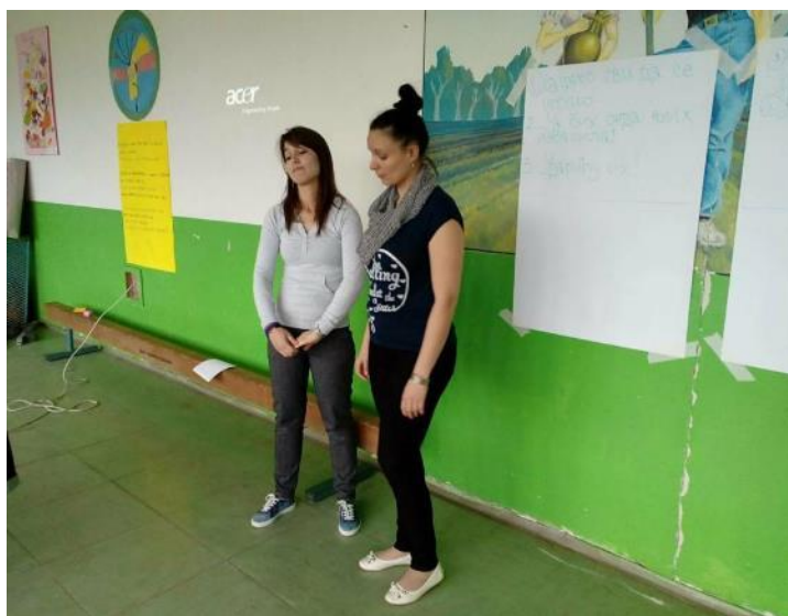
скеч - како рећи „НЕ“