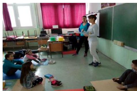
Метод "Шест шешира" у проналажењу решења у вези ситуације вршњачког насиља