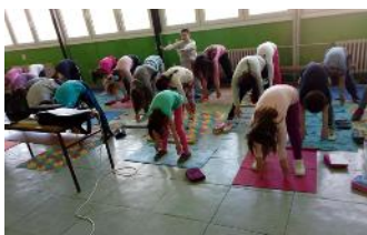
„грљење дрвећа“ (Tai chia chuan)