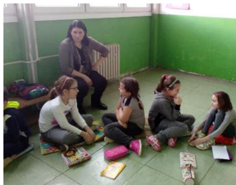
Упознавање чланова пројекта