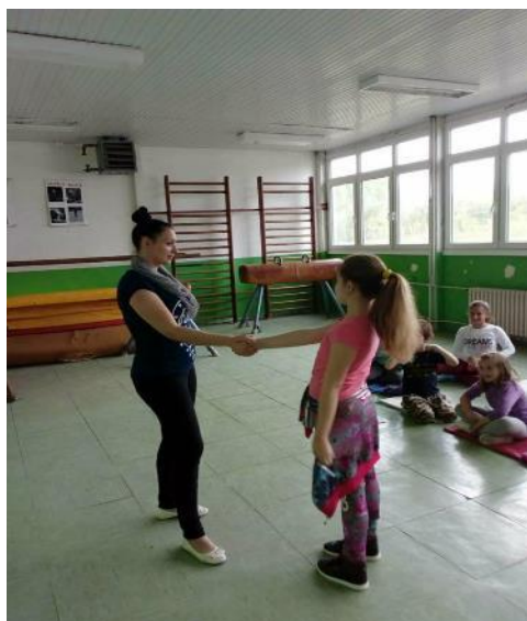
први сусрет - први утисак

ЦИЉЕВИ: Вежбање остављања доброг првог утиска. Оспособљавање деце да се боре за своје место, бране свој став; вербалне туче са насилницима. Истицање значаја изражавања мишљења, комуникације.